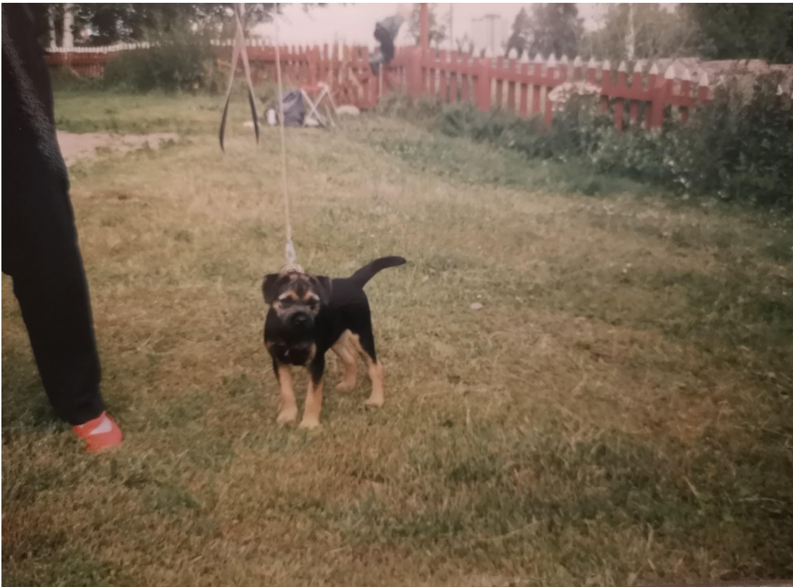
FIN MVA FIN KVA Chubby's Virginia