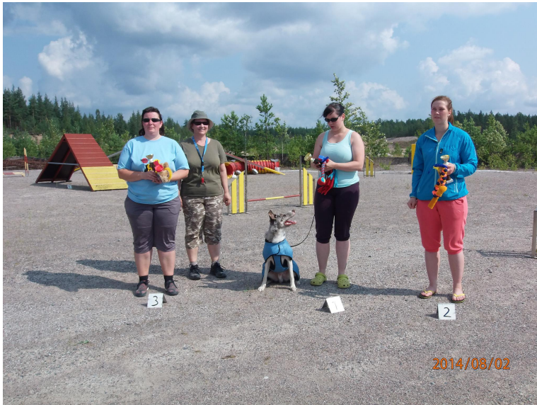
Raseborgs agility CUP 2014 MAXI koirien sijoittuneet

Yhdistyksellä on tämän jälkeen ollut satunnaisia epävirallisia kilpailuja.