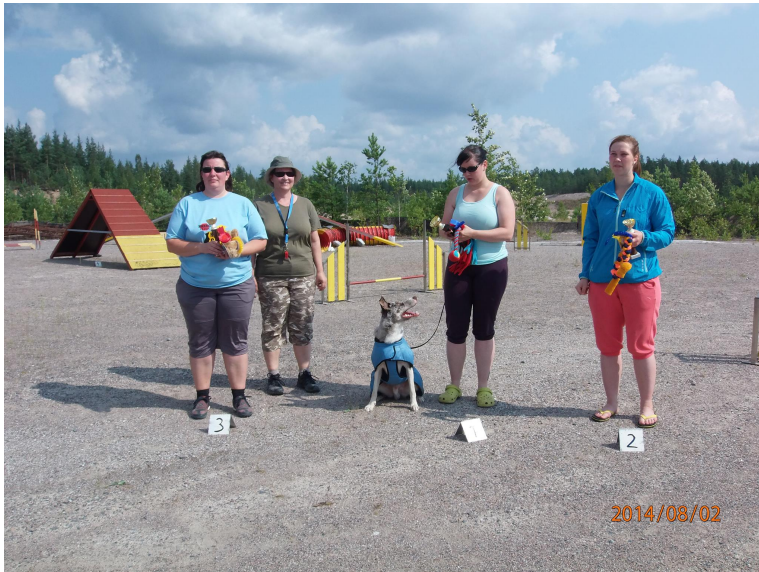
Raseborgs agility CUP 2014 placerade MAXI hundar.

Föreningen har sporadiskt haft inofficiella tävlingar efter detta.