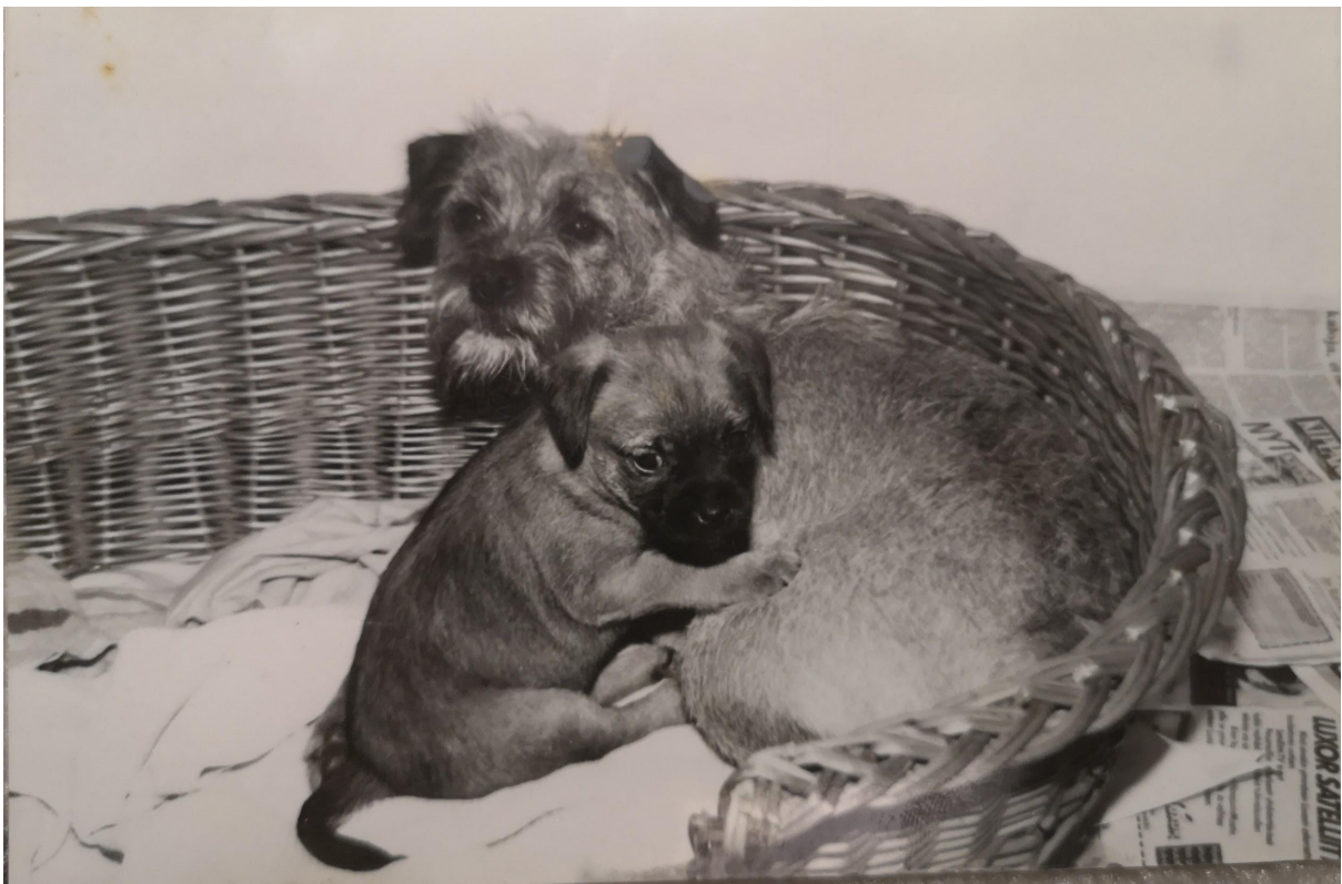
Borderterrier tiken från Chubby's kennel med sin valp.

Föreningen har medlemmar som gått Finska Kennelklubbens instruktörsutbildning för vardagslydnad.